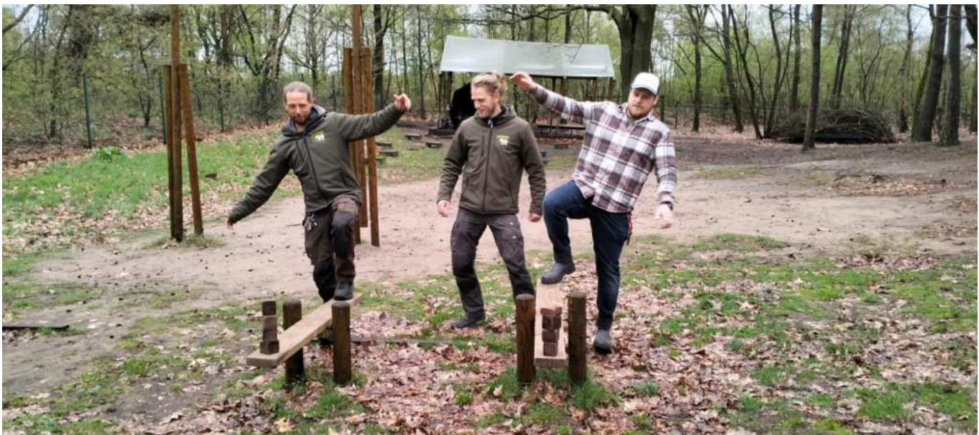
blijf door wisselen tot iedere deelnemer is geweest